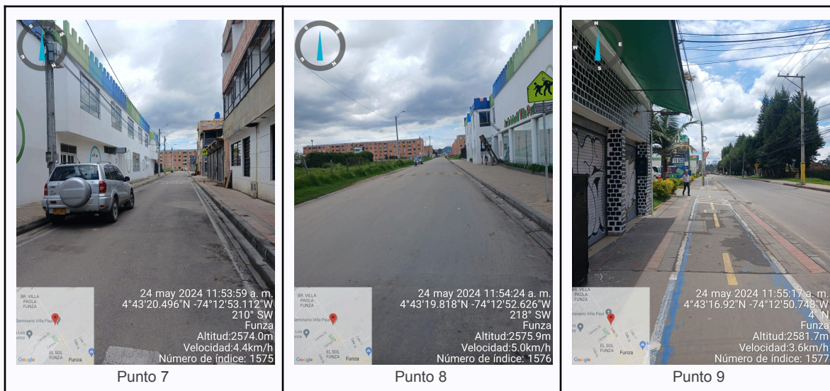
Ilustración 2. Fotos de los puntos del Recorrido de Control Y Vigilancia.